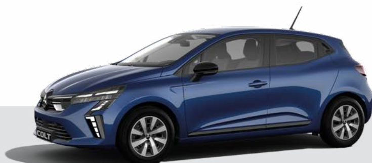
Metalizowany Royal Blue - RQH ▲