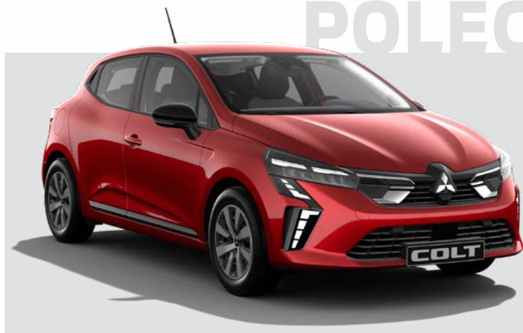
1.0T LPG Invite