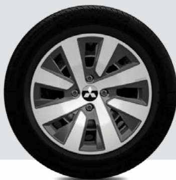
Felgi 15 calowe stalowe