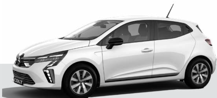
Niemetalizowany Artic White - 369 ▲