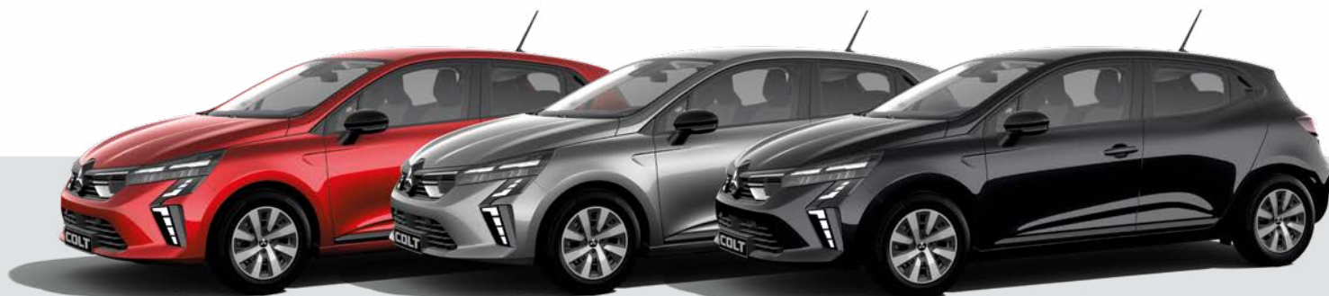
Metalizowany Onyx Black - GNE ▲